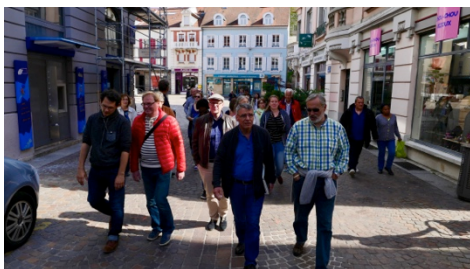
Photo 3 : Découverte de la ville de Montbéliard et de son histoire