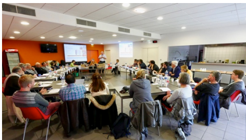
Photo 2 : Le comité de programme CME 2018 au travail : une ambiance studieuse